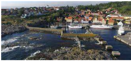
Udsigt over Gudhjem

Turen starter med at vi kører til Østerlars Rundkirke , Bornholms største rundkirke. Herfra videre til Gudhjem, en af Danmarks smukkeste beliggende byer. Her bliver der et ophold, til at se byen på egen hånd. Derefter videre til Helligdomsklipperne, her gøres ophold hvor der er mulighed for at spise den medbragte mad samt se klipperne og ”den sorte gryde”. Turen fortsætter videre igennem Tejn, Sandkås og tvillingebyerne Allinge-Sandvig til Hammershus slotsruin, hvor der er ophold for at se på borgen. Herfra videre til Vang hvor der er mulighed for at vandre til Jons Kapel. Derefter går turen hjemad, forbi Ruts Kirke igennem Klemensker, Årsballe, Østerlars og Østermarie.