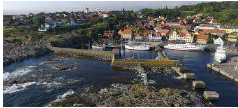
Udsigt over Gudhjem

I stedet for Natur Bornholm kan man besøge Rønne By eller Bornholms Rovfugleshow