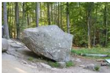
Rokkestenen i Paradisbakkerne

Som alternativ til Brændesgårdshaven, kan man vælge enten Natur Bornholm i Åkirkeby, som er et natur- og oplevelsescenter, der gennem interaktive udstillinger, virtuel teknologi, samt naturvejledning har til formål at styrke interessen og forståelsen for øens natur og kultur. Eller Bornholmertårnet på Dueodde det er et oplevelsescenter hvor I medguide oplever et tidligere totalt hemmeligstempelt militært område. Det blev åbnet første gang for offentligheden i foråret 2015. I NATO's tidligere lyttepost er der lavet en stor billedudstilling, som fortæller om 2. Verdenskrig og Bornholms helt særlige rolle, hvor øen blev bombet efter Danmarks befrielse; og især om "Den Kolde Krig" og dens betydning for øen