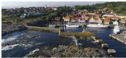
Udsigt over Gudhjem

I stedet for Natur Bornholm kan man besøge Rønne By eller Bornholms Rovfugleshow