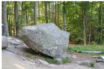
Rokkestenen i Paradisbakkerne

Som alternativ til Brændesgårdshaven, kan man vælge enten Natur Bornholm i Åkirkeby, som er et natur- og oplevelsescenter, der gennem interaktive udstillinger, virtuel teknologi, samt naturevejledning har til formål at styrke interessen og forståelsen for øens natur og kultur. Eller Bornholmertårnet på Dueodde det er et oplevelsescenter hvor I medguide oplever et tidligere totalt hemmeligstempleet militært område. Det blev åbnet første gang for offentligheden i foråret 2015. I NATO's tidligere lyttepost er der lavet en stor billedudstilling, som fortæller om 2. Verdenskrig og Bornholms helt særlige rolle, hvor øen blev bombet efter Danmarks befrielse; og især om "Den Kolde Krig" og dens betydning for øen