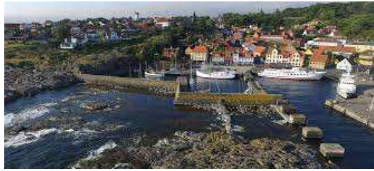
Udsigt over Gudhjem

Fra Rønne kører vi gennem Hasle Lystskov og Hasle til Johns Kapel herfra går I til Vang. Fra Vang kører vi til Hammershus hvor der er mulighed for at spise den medbragte madpakke samt se på borgen. Videre gennem tvillingebyerne Sandvig og Allinge, op langs kysten til Helligdomsklipperne, hvor der er ophold til at se klipperne og ”den sorte gryde”. Herefter videre til Gudhjem, en af Danmarks smukkeste beliggende byer. Her bliver der et ophold, til at se byen på egen hånd. Herfra kører vi til Østerlars Rundkirke Bornholms største rundkirke, som er vores sidste stop i dag.