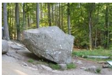
Rokkestenen i Paradisbakkerne

Som alternativ til Brændesgårdshaven, kan man vælge enten Natur Bornholm i Åkirkeby, som er et natur- og oplevelsescenter, der gennem interaktive udstillinger, virtuel teknologi, samt naturvejledning har til formål at styrke interessen og forståelsen for øens natur og kultur. Eller Bornholmertårnet på Dueodde det er et oplevelsescenter hvor I medguide oplever et tidligere totalt hemmeligstempleet militært område. Det blev åbnet første gang for offentligheden i foråret 2015. I NATO's tidligere lyttepost er der lavet en stor billedudstilling, som fortæller om 2. Verdenskrig og Bornholms helt særlige rolle, hvor øen blev bombet efter Danmarks befrielse; og især om "Den Kolde Krig" og dens betydning for øen