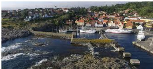
Udsigt over Gudhjem

Fra Rønne kører vi gennem Hasle Lystskov og Hasle til Johns Kapel herfra går I til Vang. Fra Vang kører vi til Hammershus hvor der er mulighed for at spise den medbragte madpakke samt se på borgen. Videre gennem tvillingebyerne Sandvig og Allinge, op langs kysten til Helligdomsklipperne, hvor der er ophold til at se klipperne og ”den sorte gryde”. Herefter videre til Gudhjem, en af Danmarks smukkeste beliggende byer. Her bliver der et ophold, til at se byen på egen hånd. Herfra kører vi til Østerlars Rundkirke Bornholms største rundkirke, som er vores sidste stop i dag.