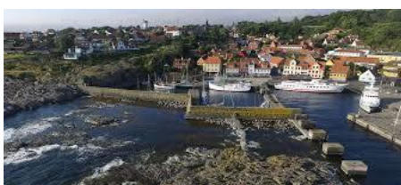
Udsigt over Gudhjem

Turen starter med at vi kører til Østerlars Rundkirke , Bornholms største rundkirke. Herfra videre til Gudhjem, en af Danmarks smukkeste beliggende byer. Her bliver der et ophold, til at se byen på egen hånd. Derefter videre til Helligdomsklipperne, her gøres ophold hvor der er mulighed for at spise den medbragte mad samt se klipperne og ”den sorte gryde”. Turen fortsætter videre igennem Tejn, Sandkås og tvillingebyerne Allinge-Sandvig til Hammershus slotsruin, hvor der er ophold for at se på borgen. Herfra videre til Vang hvor der er mulighed for at vandre til Jons Kapel. Derefter går turen hjemad, forbi Ruts Kirke igennem Klemensker, Årsballe, Østerlars og Østermarie.