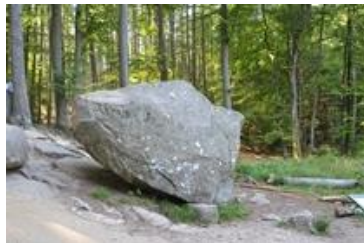
Rokkestenen i Paradisbakkerne

Som alternativ til Natur Bornholm kan man vælge enten Rønne by Eller Bornholmertårnet på Dueodde det er et oplevelsescenter hvor I medguide oplever et tidligere totalt hemmeligstempleet militært område. Det blev åbnet første gang for offentligheden i foråret 2015. I NATO's tidligere lyttepost er der lavet en stor billedudstilling, som fortæller om 2. Verdenskrig og Bornholms helt særlige rolle, hvor øen blev bombet efter Danmarks befrielse; og især om "Den Kolde Krig" og dens betydning for øen